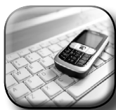
Asesoramiento en telecomunicaciones.