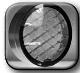
Productos alta eficiencia energética.