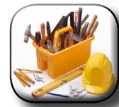
Servicios de Oficina Técnica.