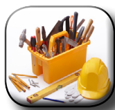
Servicios de Oficina Técnica.