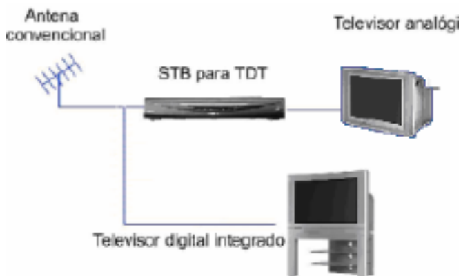
Imagen extraída del documento informativo del foro técnico de la televisión digital