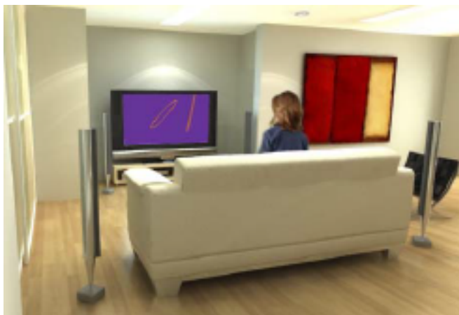
Imagen extraída de la página web: www.televisiandigital.es

La TDT es una modalidad de televisión digital, como lo es también la televisión digital por satélite, la televisión digital por cable o la televisión digital por par de cobre (ADSL). La diferencia es que se recibe a través de la antena de la televisión analógica normal, disponible en todas las viviendas.